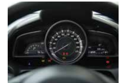
Moderno tablero frontal.