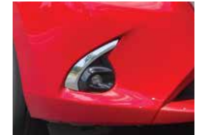
Detalle cromado bezels de los neblineros. Disponible en Mazda 2 Sport.