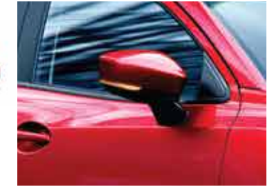
Retrovisores con señalizadores incorporados.