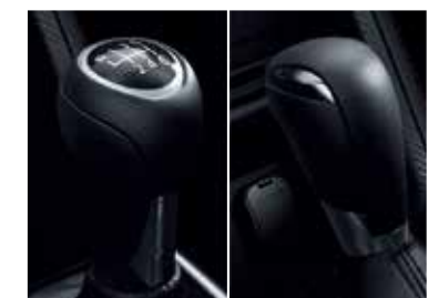
Caja Manual ó Automática de 6 velocidades.