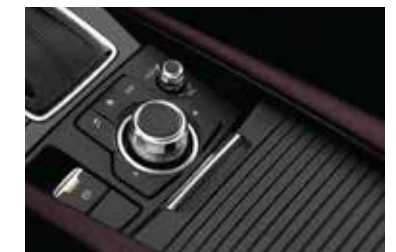
HMI Commander, freno de mano eléctrico