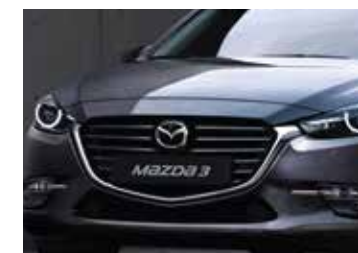
Nueva máscara frontal