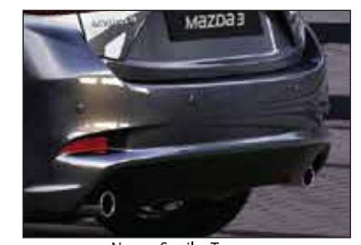
Nuevo Spoiler Trasero