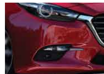
Nuevo diseño de neblineros delanteros