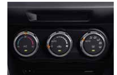
Aire acondicionado (Versión HIGH)