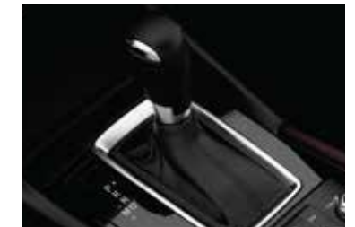
Caja automática de 6 velocidades con modo secuencial y Sport (Versión AT)