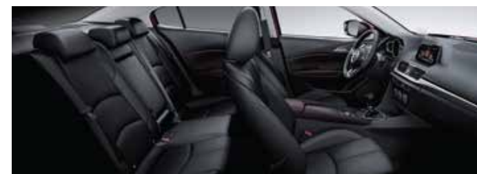
Amplio y ergonómico espacio interior