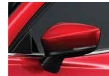
Nuevo diseño de señalizador en retrovisores