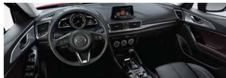
Moderno tablero frontal de lujo con pantalla táctil y controles de mando

Los detalles y especificaciones descritos están sujetos a cambios sin previo aviso. Consulte a su concesionario Mazda para obtener información más precisa del equipamiento vigente.