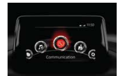
Nueva pantalla central