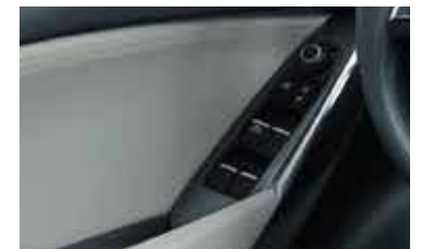
Alzavidrios y espejos eléctricos