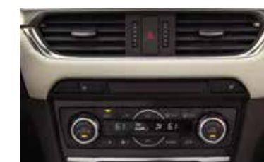
Aire acondicionado automático y calefacción