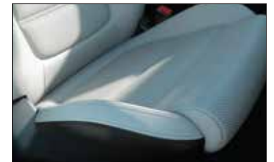
Asientos tapizados en cuero o tela, ajustables electrónicamente