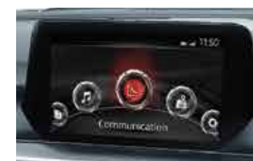
Sistema de sonido con pantalla táctil de 7"