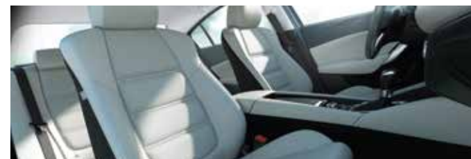
Amplio y cómodo espacio interior