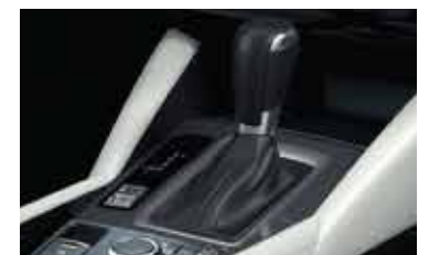
Caja automática de 6 velocidades con modo secuencial