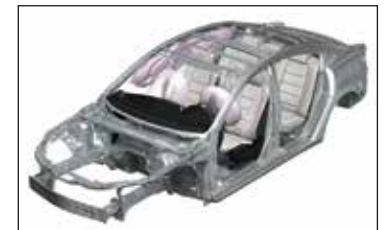
Airbags frontales, laterales y tipo cortina