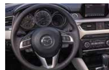
Controles de audio y teléfono al volante