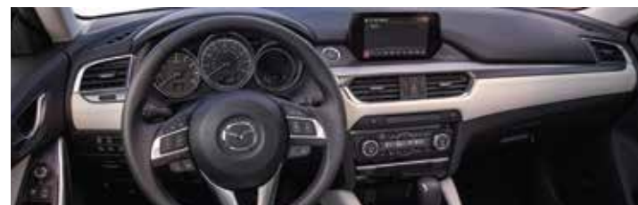
Tablero frontal de lujo, moderno y ergonómico

"Los detalles y especificaciones descritos están sujetos a cambios sin previo aviso. Consulte a su concesionario Mazda para obtener información más precisa del equipamiento vigente."