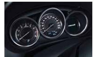
Tablero digital de lujo