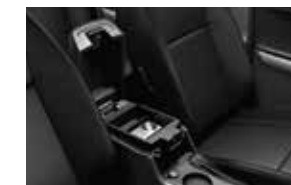
Consola central de doble fondo