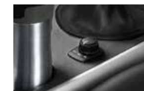
Botón de control 2H, 4H y 4L