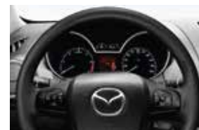
Tablero de instrumentos ergonómico