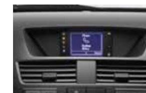
Sistema de manos libres Bluetooth (HIGH)