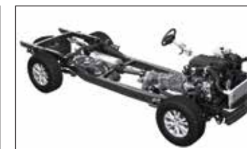
Chasis y suspensión reforzado