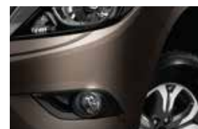
Neblineros y aros de aleación (HIGH)