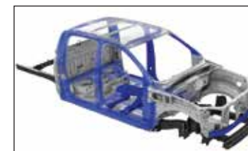
Cabina especialmente reforzada