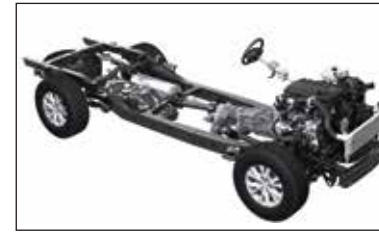
Chasis y suspensión reforzado