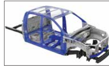
Cabina especialmente reforzada