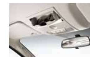
Consola porta anteojos en el techo