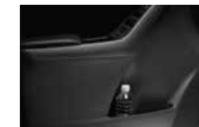
Alzavidrios y espejos eléctricos