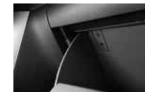
Puerto USB y Auxiliar