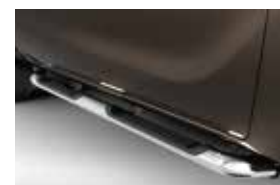
Pisaderas laterales (HIGH)