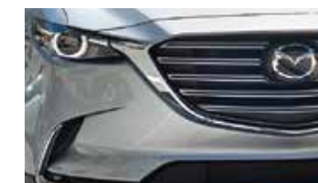
Nuevo diseño global