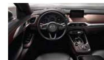
Moderno y visible panel frontal

"Los detalles y especificaciones descritos están sujetos a cambios sin previo aviso. Consulte a su concesionario Mazda para obtener información más precisa del equipamiento vigente."