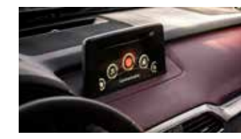
Pantalla Touch Screen (MZD CONNECT)