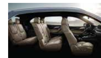
3 filas de asientos