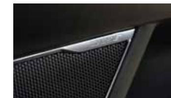
Sistema de sonido Bose